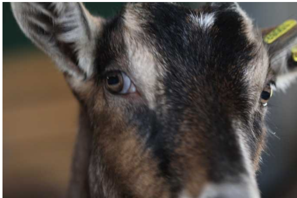
race = Alpine Chamoise